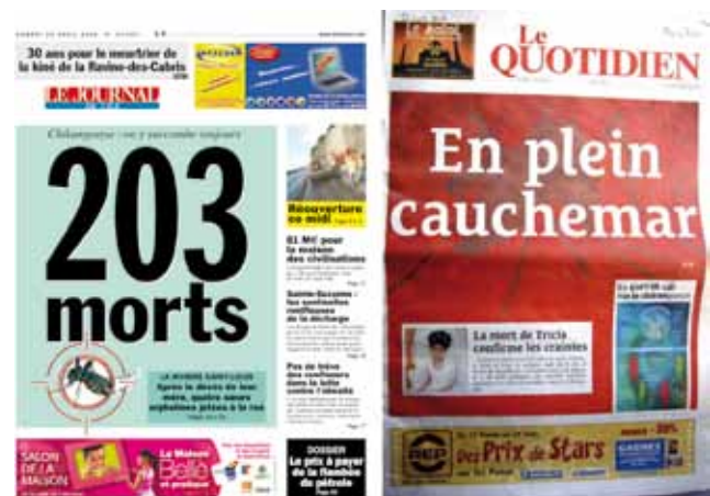
Figure 2 : Ces « unes » du Journal de l'Île de la Réunion (22/04/06) et du Quotidien de La Réunion (22/02/06) évoquent bien les moments « paroxysmiques » d'intensité médiatique.

24/02/06) ; « 157 000 cas, 77 morts. HÉCATOMBE », (pleine une, Jir , 25/02/06 + 13 pages intérieures).