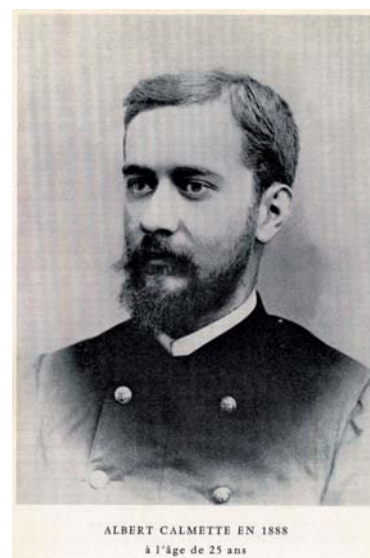
Figure 1. Albert Calmette en 1888