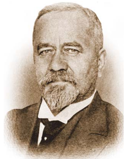
Figure 6. Albert Calmette (1863-1933)

À bord, de nombreuses punitions sont infligées pour « ivresse à terre », confortant le sentiment de Calmette lorsqu'il écrit que dans ce pays sévit la « gabonite », un curieux amollissement dû à une atmosphère humide et étouffante qui enlève à beaucoup d'Européens