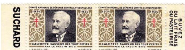
Figure 5. Timbre poste du Comité national de défense contre la tuberculose : Calmette sauveur des tout petits par le vaccin BCG (1934).

La station locale du Golfe de Guinée se compose en 1886 de nombreux bâtiments : l'avis transport Pourvoyeur , les avisos de 2 e classe et de 3 e classe Mésange , Laprade et Basilic , les chaloupes à vapeur Pygmée , Rubis et Turquoise (annexes de l' Alceste ) ainsi que Saphir , la citerne à vapeur Como , le cutter colonial Courrier assurant le service postal entre le Gabon et Sao Tomé et celui du service de la douane, le Surveillant . Et enfin l' Alceste , navire-ponton utilisé comme navire-hôpital.