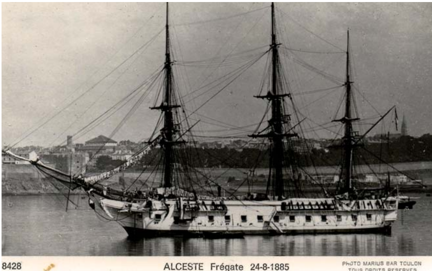
8428 ALCESTE Frégate 24-8-1885