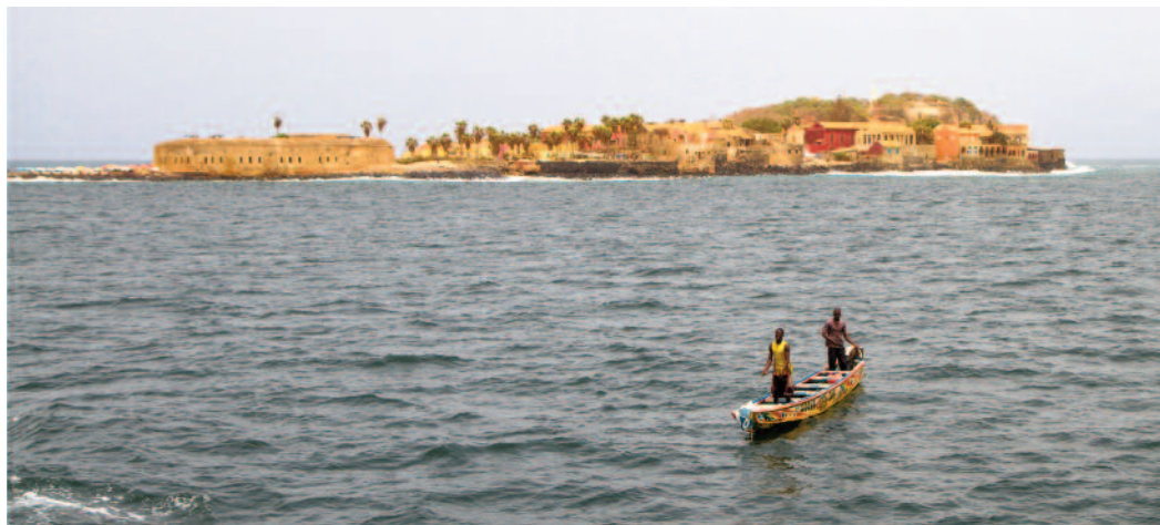
Soir sur Gorée