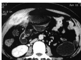
Figure 2. TDM abdominale : masse hétérogène de la paroi abdominale antérieure droite envahissant le péritoine et l'épiploon.