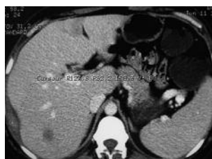
Figure 3. Scanner abdominal avec injection de produit de contraste : lésion hépatique de 10 mm de diamètre du segment VI se rehaussant intensivement en périphérie. Un second nodule sous capsulaire du même segment du foie.