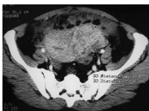
Figure 1. Scanner pelvien avec injection de produit de contraste : masse pelvienne latéro-utérine gauche de 70 x 55 mm de grande axe qui se rehausse de façon hétérogène délimitant des zones hypodenses et adhérentes aux anses digestives et à l'épiploon.

L'autre malade âgée de 41 ans, porteuse également d'un DIU depuis sept ans non surveillé, était admise pour une douleur de la fosse iliaque droite isolée évoluant depuis un mois. La palpation abdominale de cette patiente apyrétique retrouvait une masse de la fosse iliaque droite de consistance dure et fixe au plan profond. Le toucher vaginal était normal. Il existait une anémie à 9,2 g/100 mL d'hémoglobine, un syndrome inflammatoire (vitesse de sédimentation à 110 à la première heure, CRP à 45 mg/mL). Les marqueurs tumoraux (ACE, CA125) étaient normaux. L'échographie abdominale montrait la présence au niveau de la fosse iliaque droite d'une formation anéchogène contenant de fines cloisons faisant 6 cm de diamètre associée à une composante tissulaire et une formation liquidienne à paroi fine avec des végétations endokystiques aux dépens de l'ovaire droit. La tomodesitométrie abdominale confirmait la présence au niveau du pelvis en sus latéro-utérin droit d'une masse mal limitée à double composante kystique et tissulaire qui se rehaussait après injection de produit de contraste mesurant 9x3x7,5 cm au contact du caecum et du sigmoïde (figure 4).