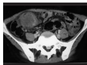
Figure 4. TDM pelvienne : masse pelvienne à double composante solide et kystique envahissant le caecum.