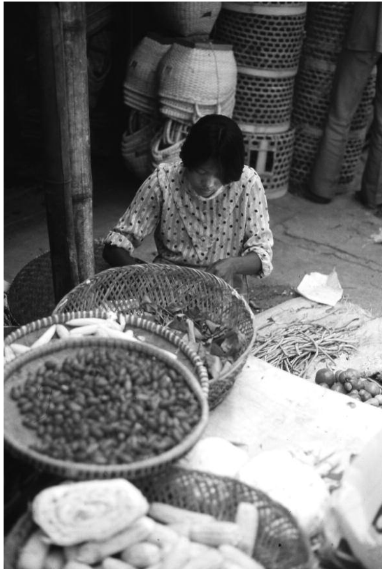
Marché de Makalé, Sulawesi, Indonésie